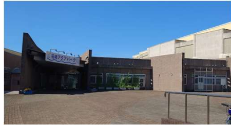
柏崎アクアパーク - Google マップ