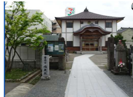
福蔵院 - Google マップ