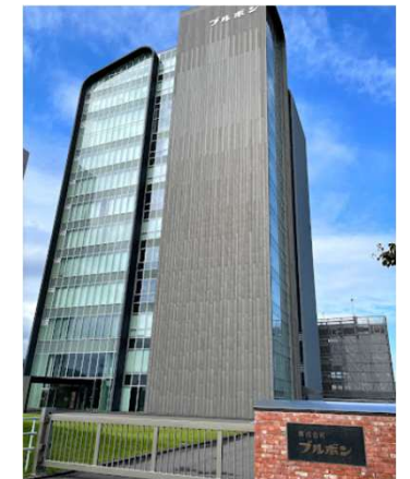
(株)ブルボン 本社 - Google マップ