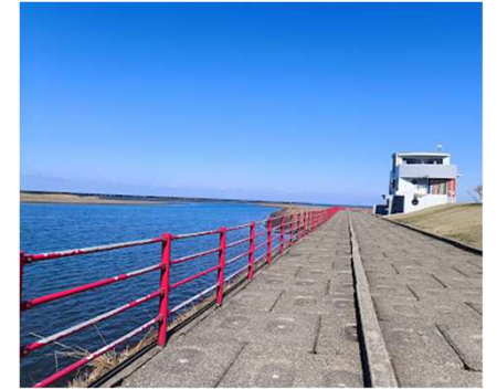
みなとまち海浜公園 - Google マップ