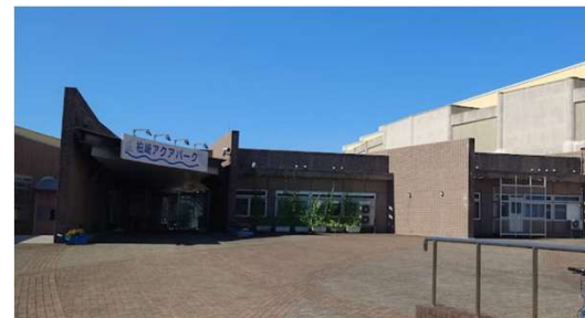
柏崎アクアパーク