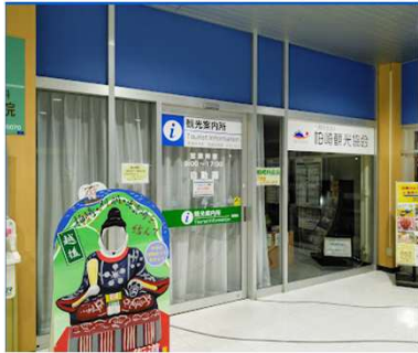
柏崎観光協会 - Google マップ