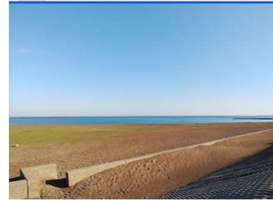
柏崎中央海水浴場 - Google マップ