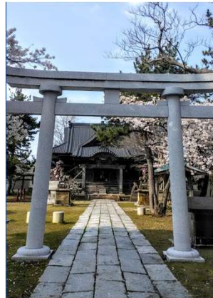
柏崎神社 - Google マップ