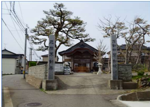
不動院 - Google マップ